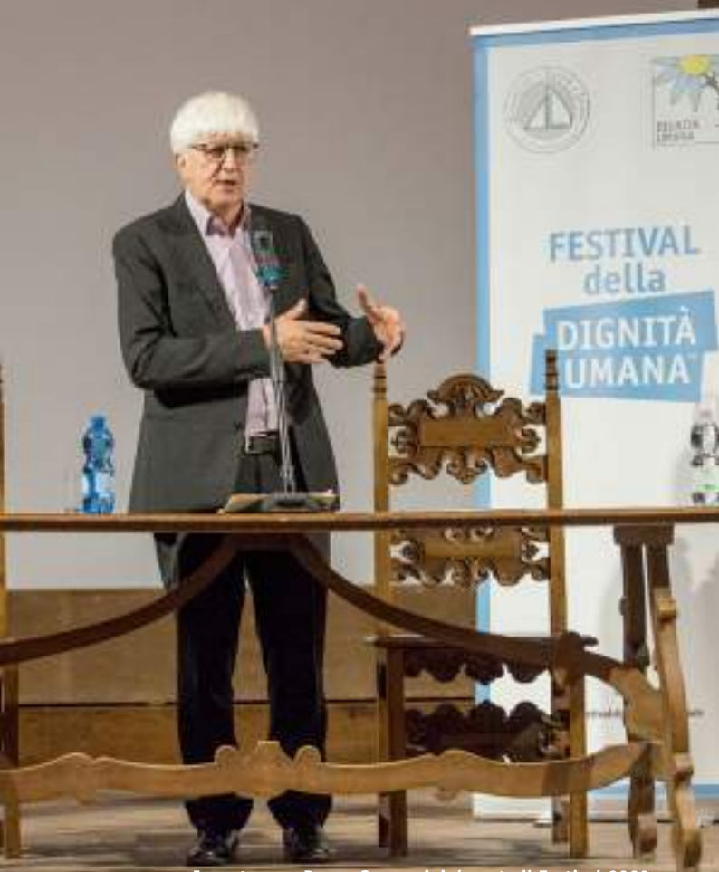
Incontro con Beppe Severgnini durante il Festival 2023